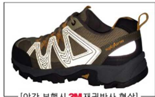
[야간 보행시 3M 재귀반사 형상]